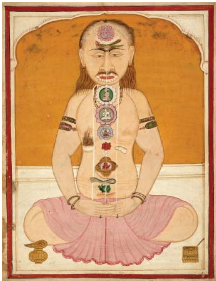
Pintura tântrica que ilustra a localização dos chacras no corpo de um indivíduo a meditar.

Na essência da terapia dos cristais moderna está o reequilibrar desses centros energéticos. Os sete grandes chacras situam-se ao longo do eixo central do corpo. Estes vórtices de energia em forma de funil absorvem e distribuem a energia vital ou chi . Cada um deles coincide com a localização e a função de uma determinada glândula endócrina, e também com pontos associados aos gânglios nervosos situados ao longo da coluna vertebral. Pensa-se que os chacras, quando a funcionar em pleno, vibram na frequência de uma das cores do arco-íris.