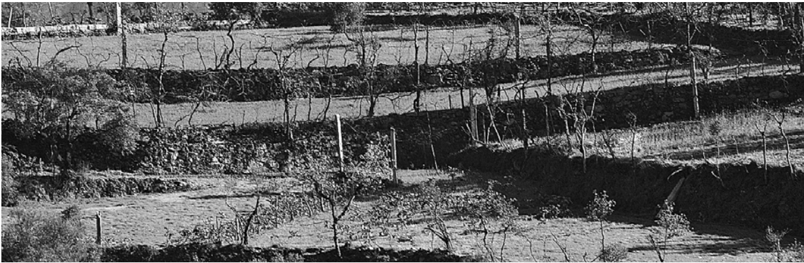
Fig. 1 – Fragmentação das propriedades.

Observe a figura 1 que representa uma paisagem agrária portuguesa.